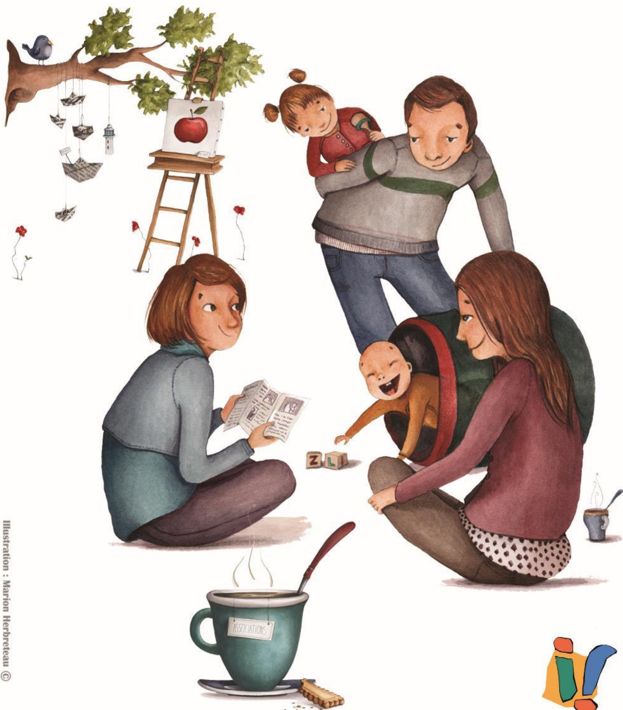
Illustration : Marion Herbreteau ©