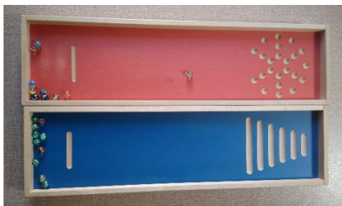
Parcours de billes n°2