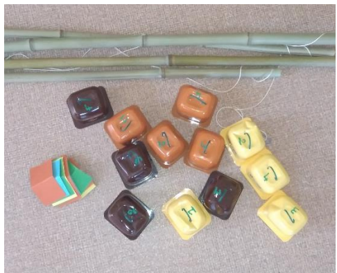
Pêche à la ligne récup