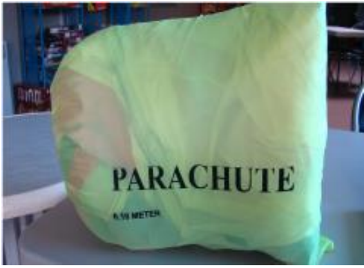
Parachute 16 poignets