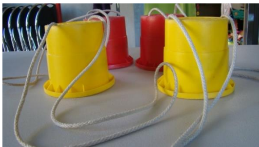
Echasses en plastiques