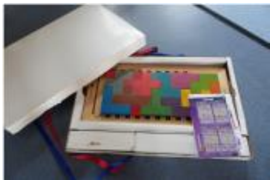
Gagne ton papa