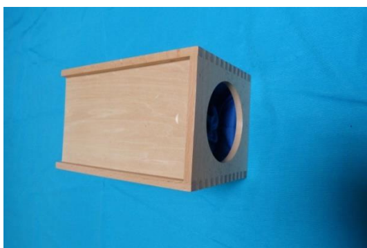
Boite à bâtons trapenium à 1