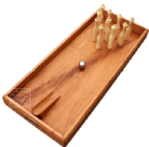
Bowling de table