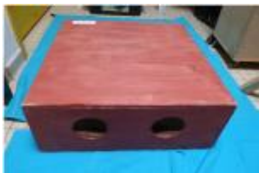
Boite à bâtons trapenium à 4