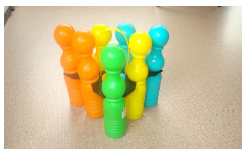
Quilles en plastique