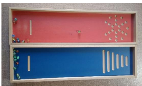
Parcours de billes n°1