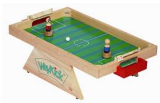
Weykick à deux