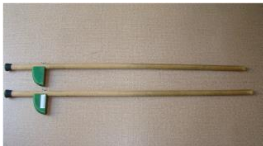
Echasses en bois