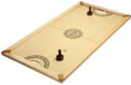
Hockey de table