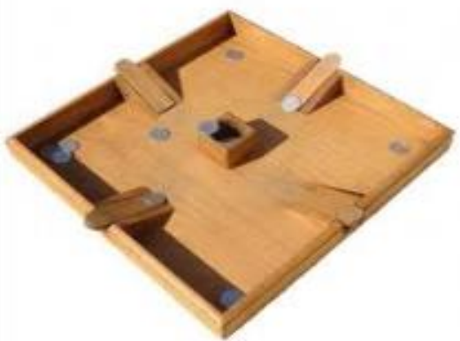
Jeu de puces