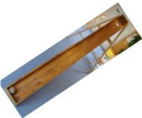
Boule à pente