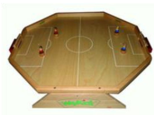
Weykick à quatre