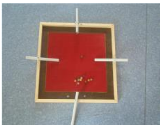
Pétanque de salon