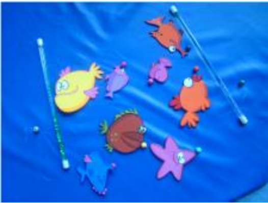
Pêche à la ligne